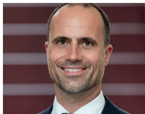
CLEMENS HOCH Minister für Wissenschaft und Gesundheit Rheinland-Pfalz