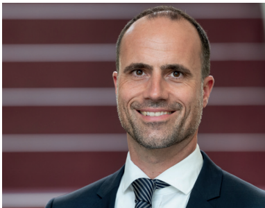
CLEMENS HOCH MINISTER FÜR WISSENSCHAFT UND GESUNDHEIT RHEINLAND-PFALZ - SCHIRMHERR

Neues Wissen entsteht gerade auch durch Vernetzung und Austausch – hierbei wünsche ich den Veranstaltungsteilnehmenden viel Erfolg!"