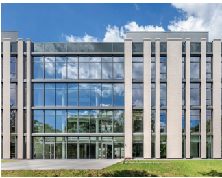
BioZentrum I und II