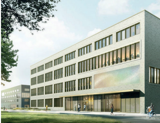
Centrum für Fundamentale Physik (CFP)